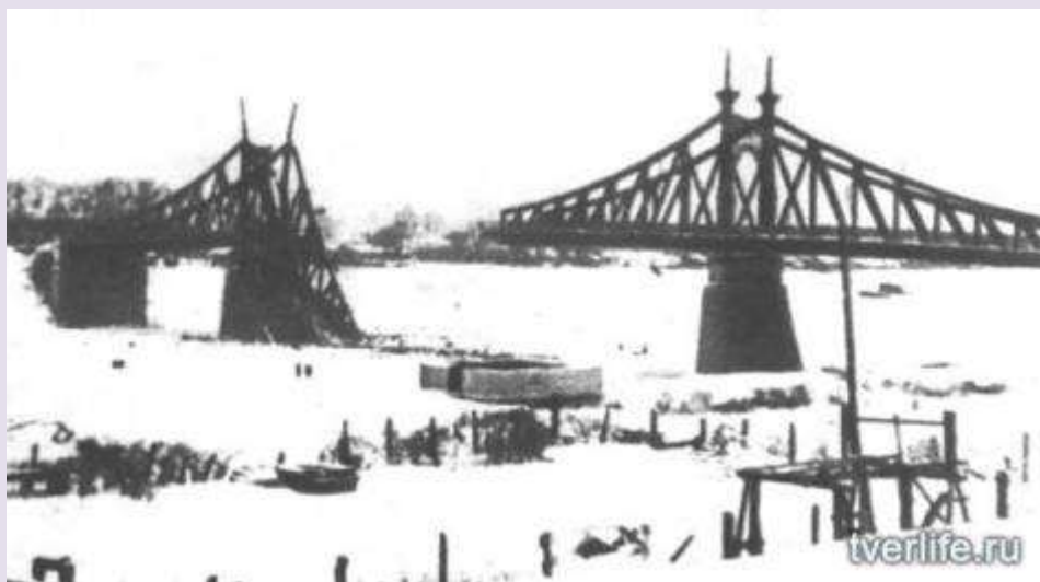
Калинин в годы ВОВ

В Великую Отечественную войну Калининская область одной из первых приняла на себя удар немецко-фашистских войск. На фронтах Отечественной войны сражалось около 700 тыс. наших земляков. Около 250 тыс. погибли. Бои под Калинином, Ржевом, Белым, мужество партизан и подпольщиков вошли в летопись Великой Отечественной как символ негибаемости духа наших земляков.