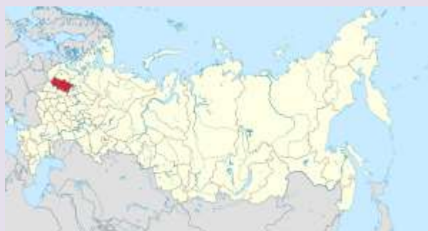
Тверская область на карте России.

80 лет – для человека это много, целая жизнь, а для области – это небольшой фрагмент, одна страница.