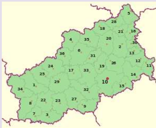
Административная карта Тверской области

Ребята познакомились с историей нашего края. Во время показа презентации сменялись слайды: такой наш край был в далёком 11 веке, а таким стал при Михаиле Тверском. Вот тверская земля в годы монголо – татарского нашествия, а вот и смутные времена. На слайдах не только города и здания, но и люди, которые связали свою судьбу с Тверской областью. Учителя нам рассказали о том, что территория нашей области не раз менялась, как менялось и само название. Мы даже не могли предположить, что с 1929 по 1935 год не было отдельной Тверской области, все районы были разделены и входили в другие области. Мы узнали, чьё имя носила Тверская земля с 1935 по 1990 год. Михаил Иванович Калинин – Всесоюзный староста, второй человек (после Сталина) в стране, наш земляк, уроженец Кашинского района. Перед войной в состав нашей области входило 69 районов и её границы совпадали с государственной границей СССР, то есть она была самой больше областью в РСФСР.