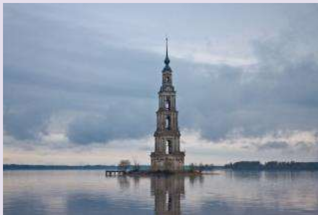
Калязин. Затопленная колокольня.

Но на мероприятии мы вспомнили наших героев – земляков, участников Великой Отечественной войны. Интересен был рассказ и об удивительных музеях на территории нашей области. Оказывается, на территории нашей области есть музей сказочных героев: в Калязине – Бабы – Яги; в Старице – Кошечья Бессмертного, а под Старицей – Змея Горыныча.