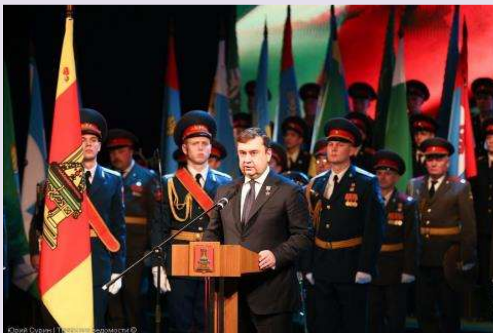
Губернатор Тверской области А.В. Шевелев

29 января Верхневолжье отмечало 80-летие образования Тверской (Калининской) области.